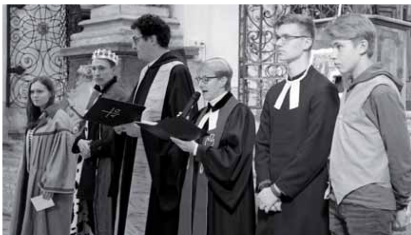
Alle Mitgestalter des ökumenischen Gottesdienstes