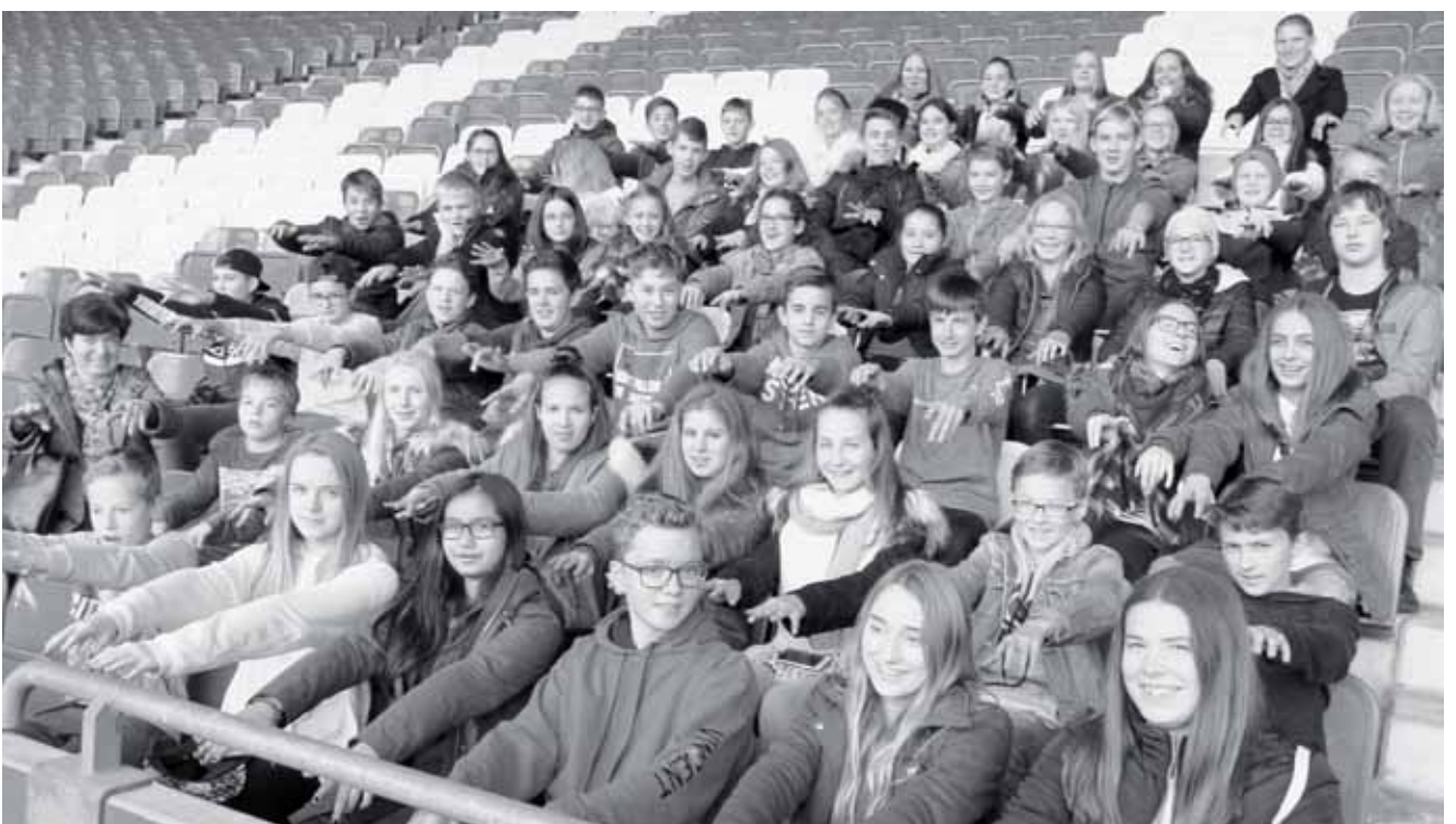
Alle Schülerinnen und Schüler im Ernst-Happel-Stadion

Die Busrundfahrt am Dienstagnachmittag, die rund um den Ring, zum Hundertwasserhaus, zur UNO-City und ins Ernst-Happel-Stadion führte, machten die drei Klassen