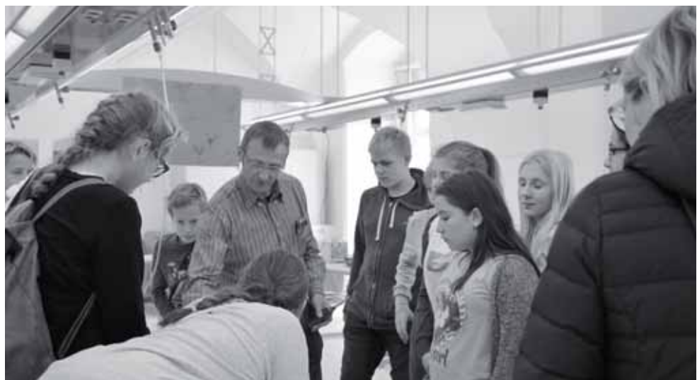
Gespannte Blicke bei den Physikversuchen