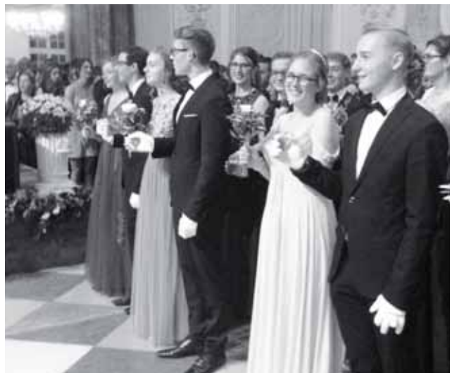
Vor der Eröffnung

„Hier stehe ich, ich kann nicht anders!“